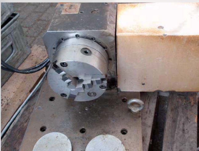
Rundtisch HAAS TR310